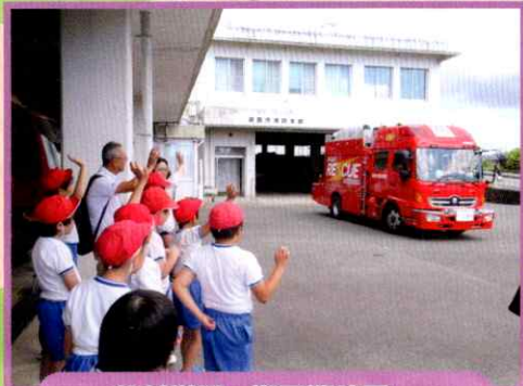
校外学習～湖西消防署～ 「はたらくひとを調べよう」