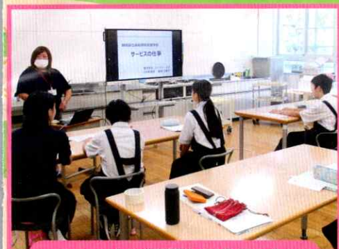
cocochi (近隣レストラン) スタッフによる接客指導