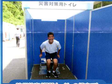
防災教育(仮設トイレの組立て)