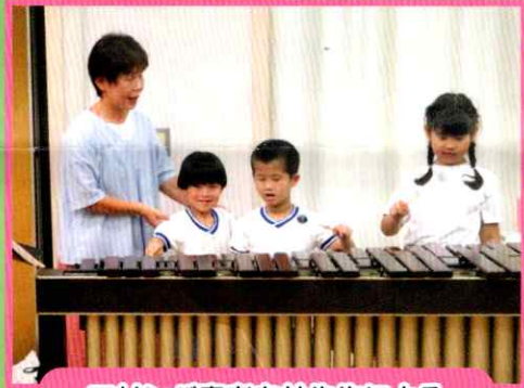
マリンバ奏者白井先生による 演奏会