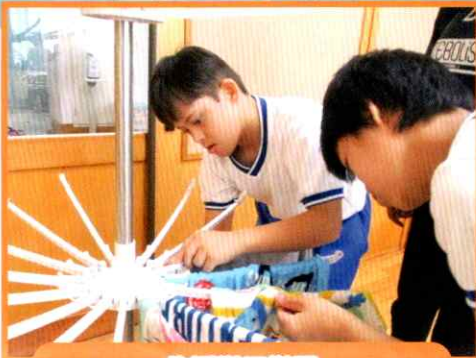
生活単元学習 「まかせて!家の仕事」