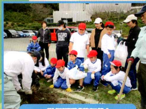
学級活動「芋ほり」 ～高等部といっしょに～