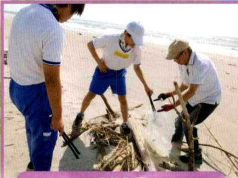
奉仕作業 (地域の方と一緒に大倉戸海岸清掃)