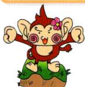
浜名特別支援学校 キャラクター 『はまなっきー』

本校の活動内容や生徒たちの様子をホームページにて公開しています。ぜひ日頃の子どもたちの様子を見てください!