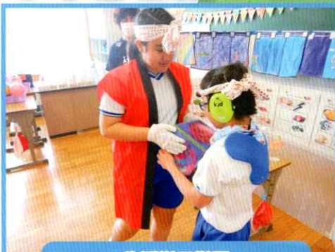
生活単元学習 「お寿司やさんをひらこう」