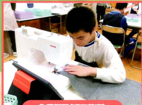
作業学習(手工芸班)