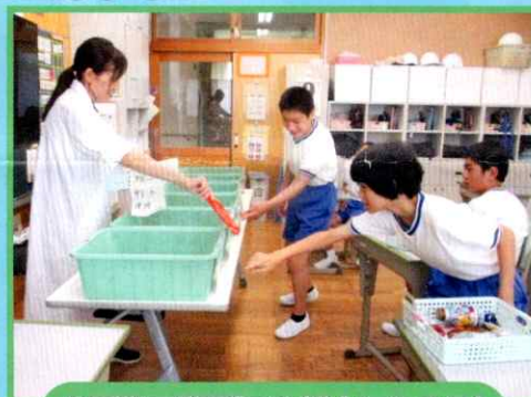
生活単元学習「ごみ博士になろう」