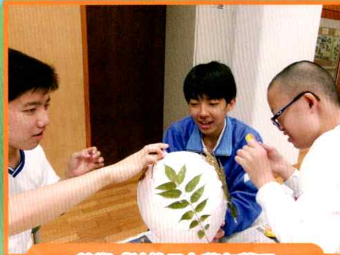
美術「はりこと落ち葉で ランプを作ろう(共同制作)」