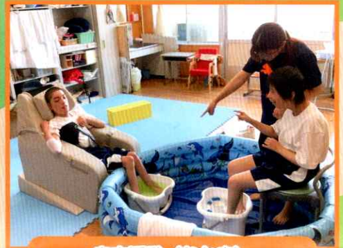
自立活動(なかま) 「いっしょに足湯に入ろう」