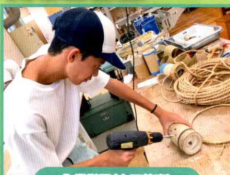
作業学習(木工芸班)