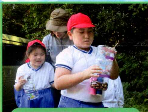
生活単元学習「あきを見つけよう」