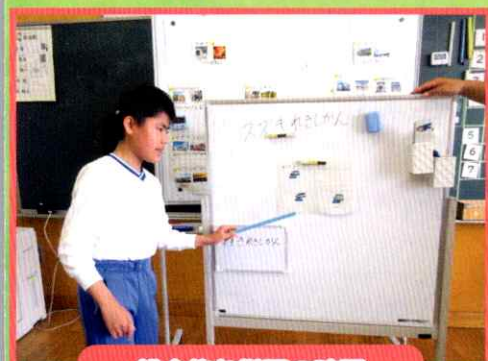
総合的な学習の時間 「浜松について知ろう」