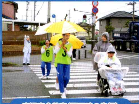
交通安全教室(雨天時の歩行)