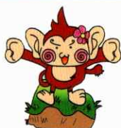
浜名特別支援学校 キャラクター 『はまなっきー』

本校の活動内容や生徒たちの様子をホームページにて公開しています。ぜひ日頃の子どもたちの様子を見てください！