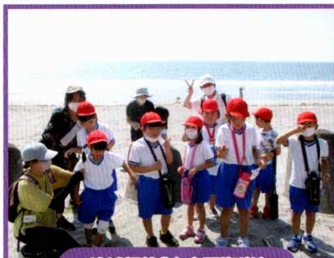
地域探検「大倉戸海岸」