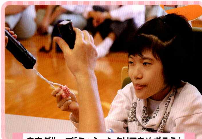
自立グループ「ミッションクリアをめざそう」