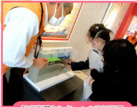
防災学習センターへの校外学習