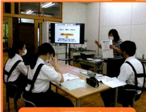
cocochi(近隣レストラン) スタッフによる接客指導