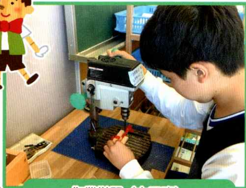
作業学習（木工班） 「ぴったり合わせた製品を作ろう」