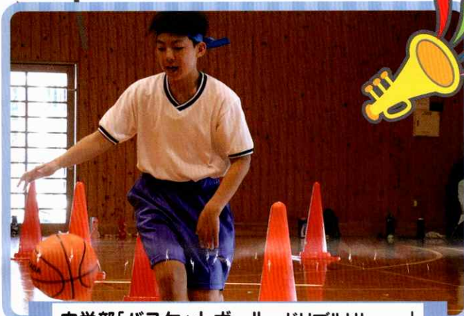
中学部「バスケットボール～ドリブルリレー～」