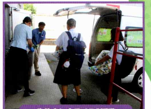
生徒会によるJRC活動 (ペットボトルキャップ納品)