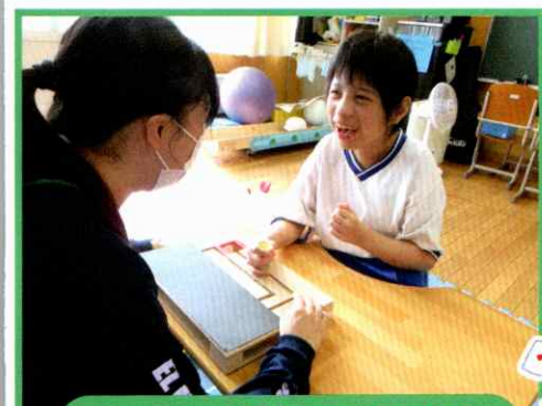
個別学習「よく見て動かそう」