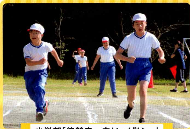
小学部「徒競走～カいっぱい～」