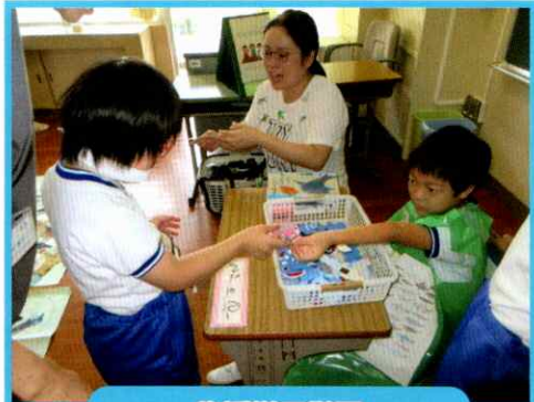
生活単元学習 「お店屋さんを開こう」