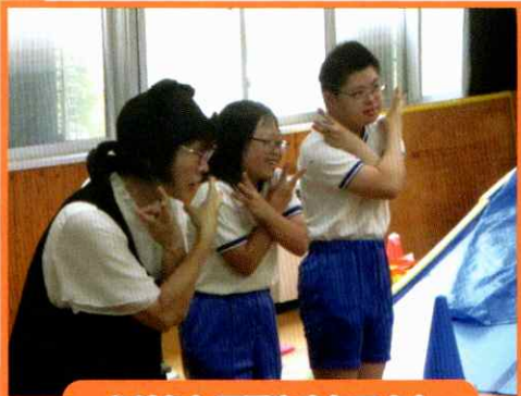
おはなし工房やまねごさん による読み聞かせ指導