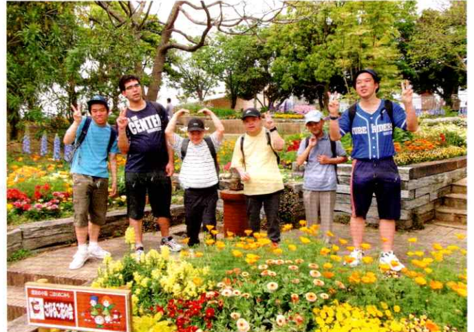
社会体験 (恵松学園)