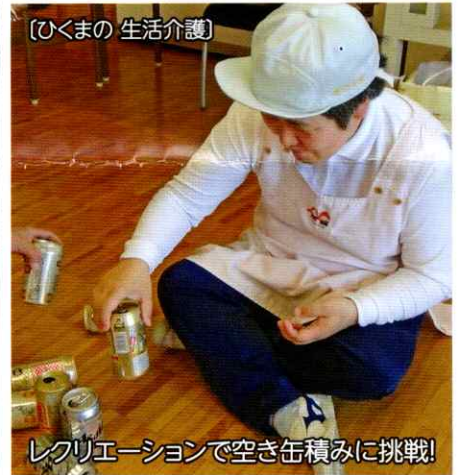
〔ひくまの 生活介護〕