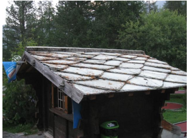
屋根瓦は石が多い！