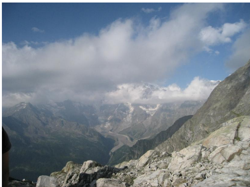
モロ峠付近よりモンテローザ