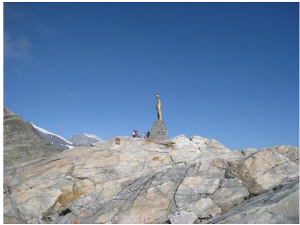
国境にあるマリア像（ローマに向かって）