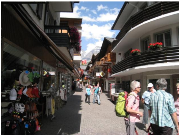
サースフェーの町

今日はサースフェーに滞在、昨日見たモンテローザ山群より東方向にあるドーム（4,327m）などが見えるミッテルアラリン（3,462m）までロープウェイ、地下ケーブルで行き景色を眺め、その後一旦サースフェーまで下山してシュピールボーデンまでロープウェイで登って景色を眺めながら下山というコース！