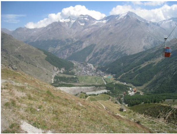
下山路からサースフェーの町