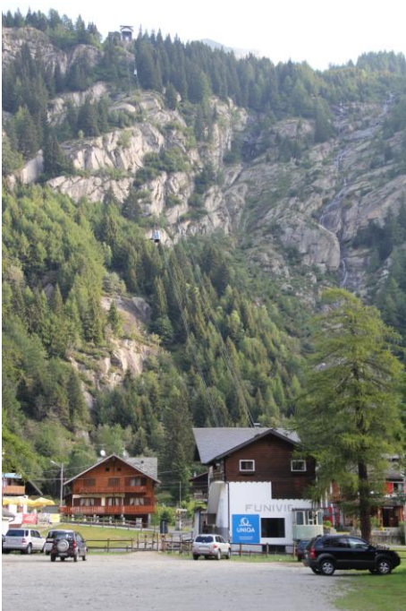
ロープウェイ、見えるのは中間駅