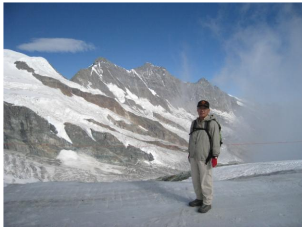
ミッテルアラリン（3,462m）にて