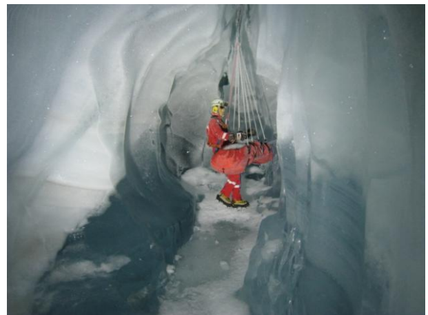
氷河博物館（氷河の中にある）