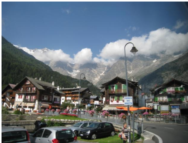
マクニャーガの街