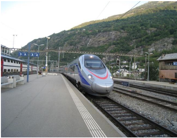
ドモドッソラ方面行きの国際列車