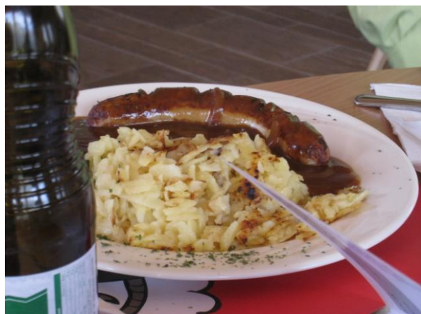
昼食 大きなウインナーが美味しい！