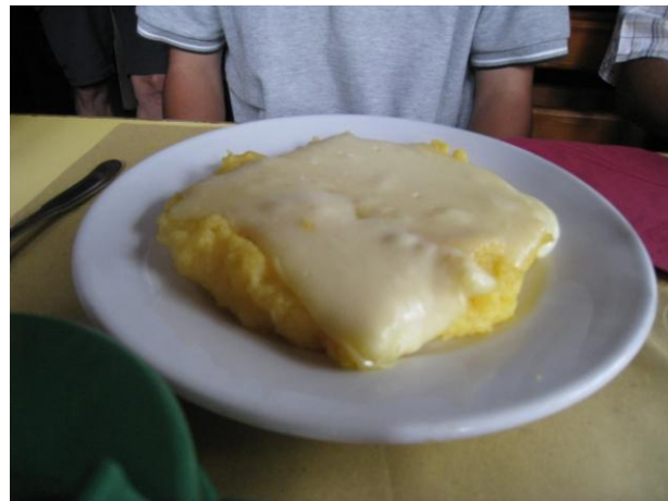
昼食 (トウモロコシを油で練って焼いてチーズ)

マクニャーガはモンテローザ山麓にあり、標高1,300m、人口650人ぐらいの村で冬はスキー、夏は避暑地として賑わう。