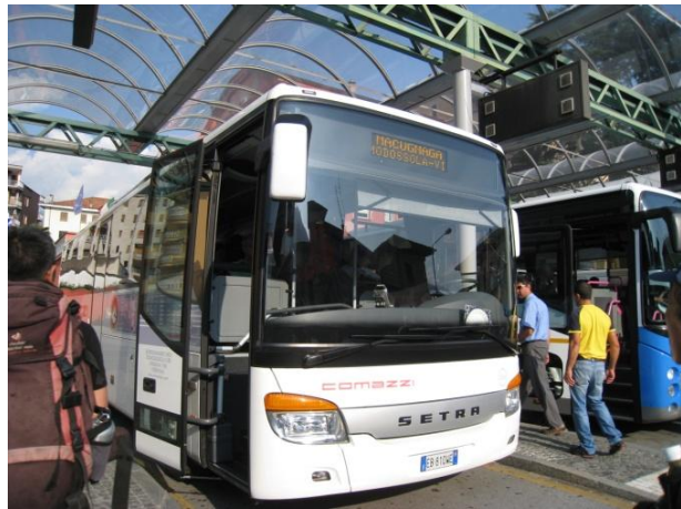
マクニャーガ行きバス