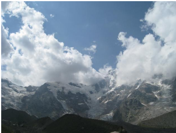
モンテローザ山群