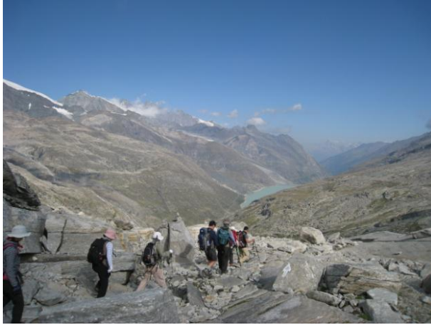
モロ峠からの下り、目指すは湖