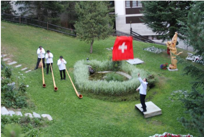
ホテルでの夕食前のアトラクション