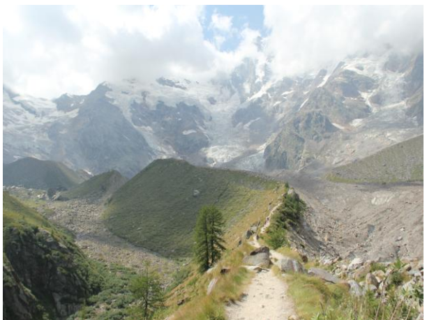
小屋に向かう登山路、右側は後退した氷河