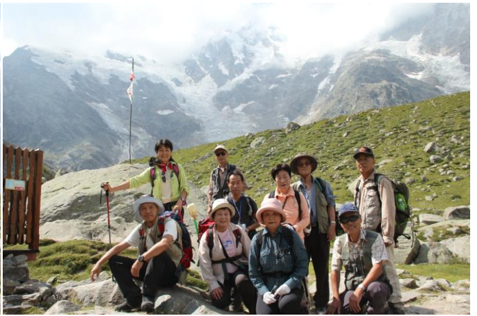
モンテローザをバックに小屋近くで