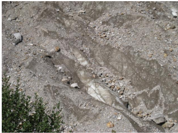
氷河 (表面は砂利だけど中は氷)