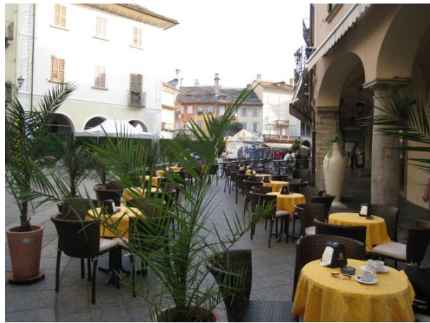
ドモドッソラの街並