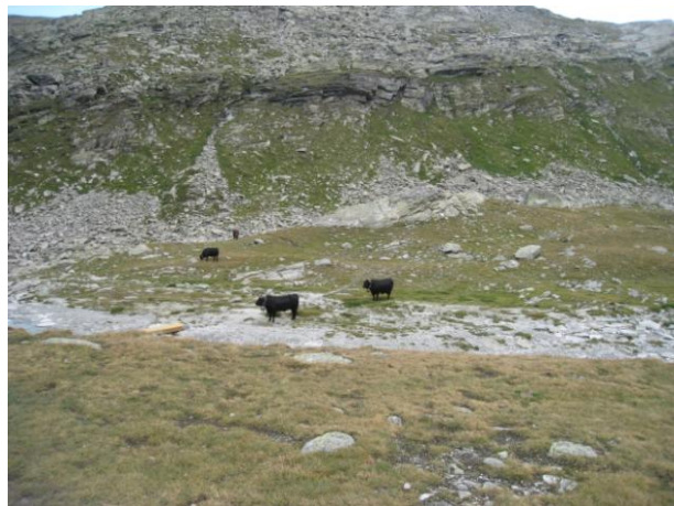
のどかな風景が疲れを癒してくれる