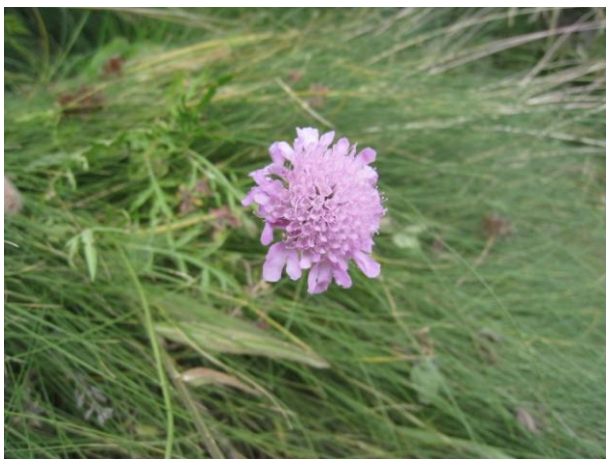
日本のマツムシソウに似た花