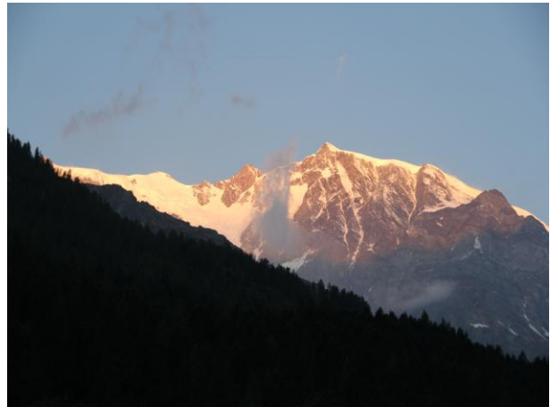
朝焼けのモンテローザ山群