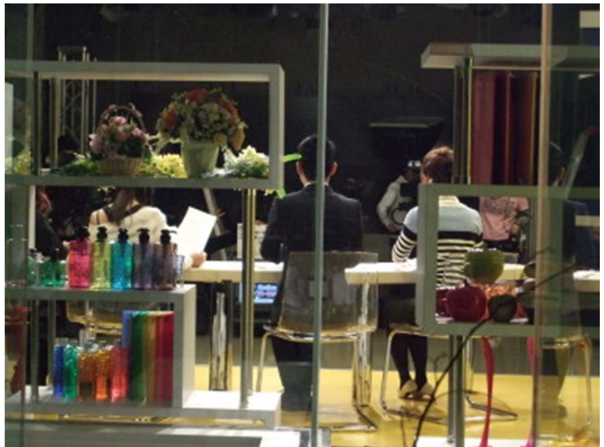
TOKYO MXTV 5時に夢中