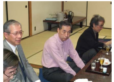
柏倉さんの近況報告