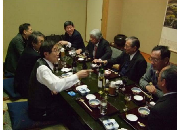
半蔵門のジャンギャバンを囲んで