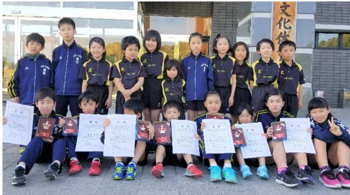
参加した19人の子どもたち