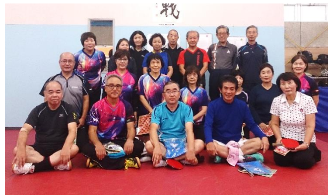
熱戦を終え みなさん充実の表情です

学校でなかなか恵まれない練習環境の中、宇土クラブでの頑張りが見事に繋がっています。