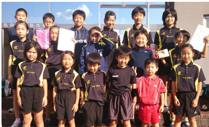
今回はバンビクラスにも5人参加しました