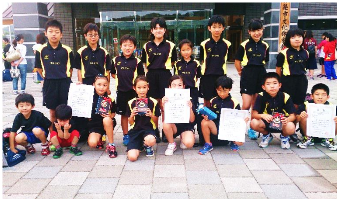
出場した小学生クラブの選手たち

今年の九州大会は、地元開催で出場枠が多いこともあり、宇土クラブから総勢14人が出場権を獲得しました。