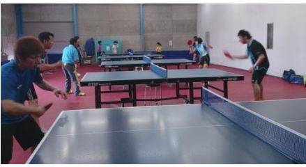
作業終了後は新ジムの感触を味わいました