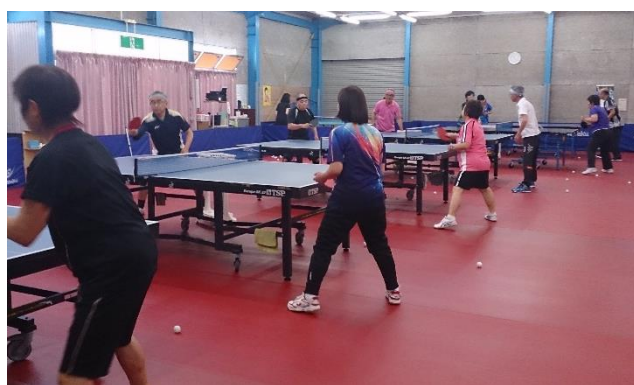
この日は14人が参加 7台で練習しました

ジムが広くなったことから、これまでのUMEクラブと初心者教室を一緒にし、このほどスタートしました。賑わいがあつていいです。