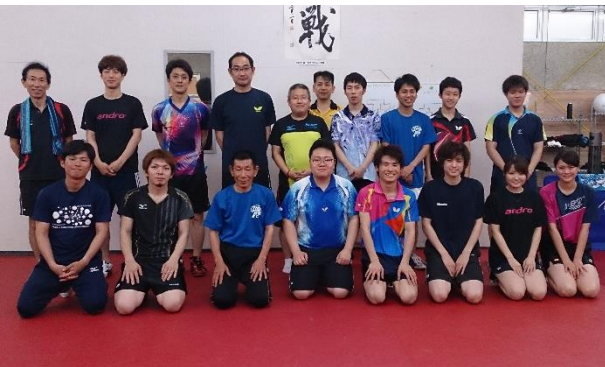
参加された18人のみなさん