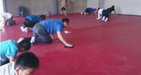
助っ人が多くマット張りも短時間で終了