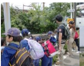
（チェックポイント24）

澄んだ青空と、時折吹く風も心地よく絶好のハイキング日和となりました。去年の8月と10月に中野島取水口と宿河原堰を見学した続きということもあり、電車で南多摩駅まで移動した後、多摩川に出て大丸用水を目指して歩きました。