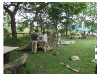
ジャンボリーテントの設営に苦戦中?!

4月の春キャンプでまだまだキャンプ体験が不足していることを痛感したので、5月にもミニキャンプを行ないました。