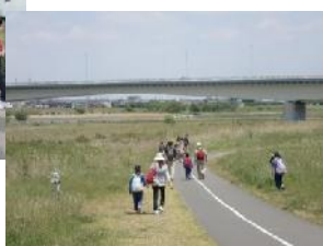
（チェックポイント23）