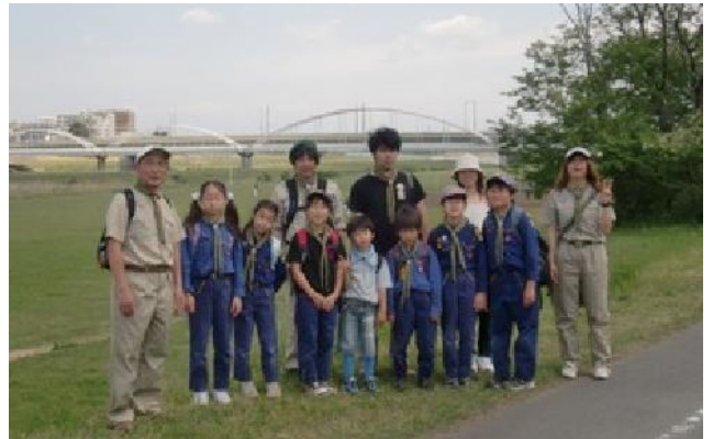
（チェックポイント22 多摩川原橋）

アカシアの花弁が舞う木漏れ日の遊歩道を抜けて多摩川原橋をバックに写真を撮ったあと矢野口から電車に乗って帰りました。