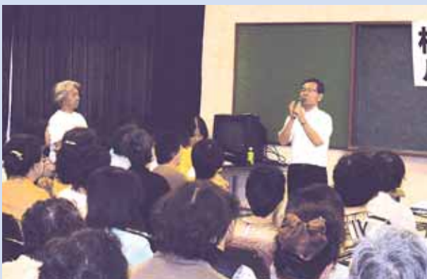
3月・6月定例会の活動報告会(女性対象)：7月8日