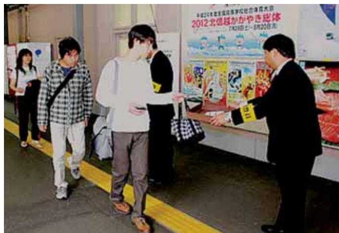
JR 北陸線の旅客流動調査で、乗客からカードを回収する調査員ら＝JR 富山駅

北陸線の旅客流動調査は、2005年11月以来約6年半ぶり。今回の調査結果は本年度内に策定する第三セクター会社の経営計画概要(最終版)の基礎資料とする。