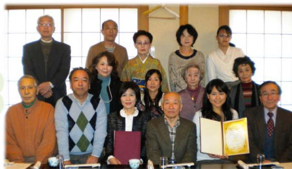
新たな一歩を踏み出しました