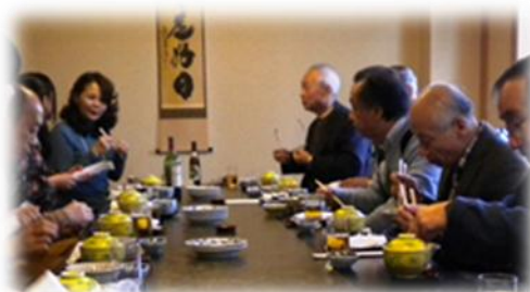
美味しい食事に舌鼓