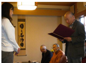
黒田理事長より認定書授与

続いての忘年会は、認定を受けた二人が喜びと感謝の心境を語り、続いて出席者が近況やこれからの抱負など語らい和やかな一日となりました。