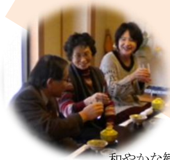
和やかな歓談のひとつ