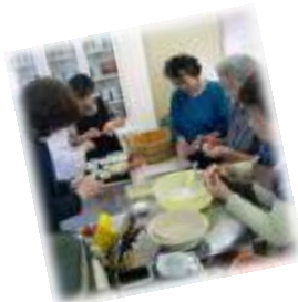
たのしくおしゃべり?!