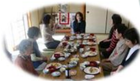
2011年3月 家族会(おひな祭り)