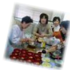
おいしくできたかな?