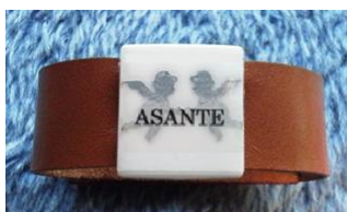
標準リストバンド