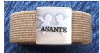
最強リストバンド