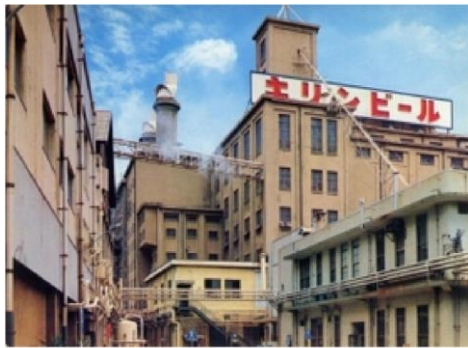
1970年代に撮影された「キリンビール尼崎工場」の外観 2020.5.13

34年10月、組合の交代期で上京した。その年の9月26日伊勢湾台風が中部、近畿を襲い死者4600人、家屋倒壊・流出83万戸という昭和9年の室戸台風と匹敵するか、或いはそれ以上の台風が襲った。東京では品川の組合寮に泊まったが、会議は青山の全