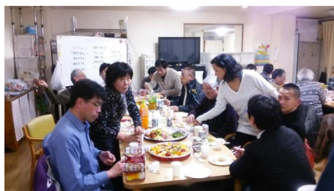
デイサービスセンター「にじの家」での交流風景

一月二八日、定例交流会「就労と介護」を阪神医療生協にじの家で開催し、二五名の参加者と交流しました。 親などの介護を理由として仕事を辞めざるを得ない「介護離職」は非正規労働者も含めると、一年に