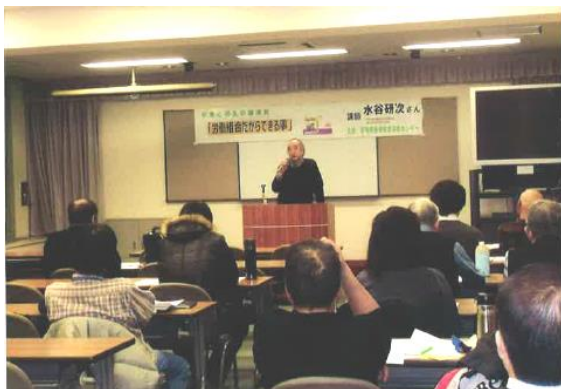
熱心に耳を傾ける参加者ら

その中でも団体交渉こそが労働組合にとって最大の武器であり、使用者側の不誠実な姿勢は「団交拒否」と見なされ法律違反となります。そ