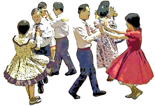
グループの中を歩く