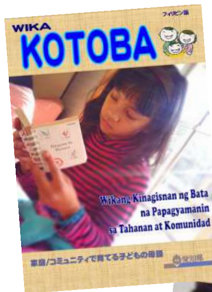
フィリピン語版 WIKANG KOTABA