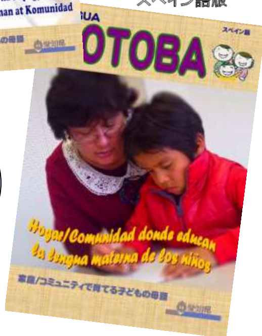
スペイン語版 WIKANG KOTABA