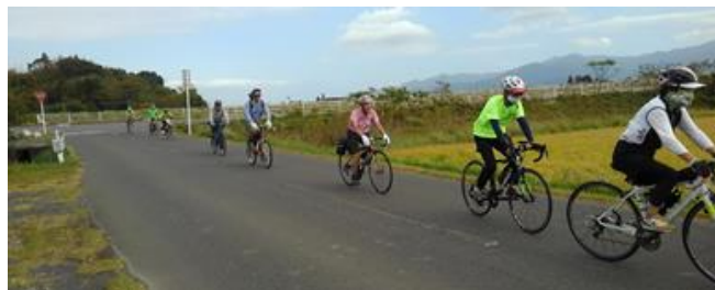
大隅半島肝属川サイクリングロードを走るメンバー