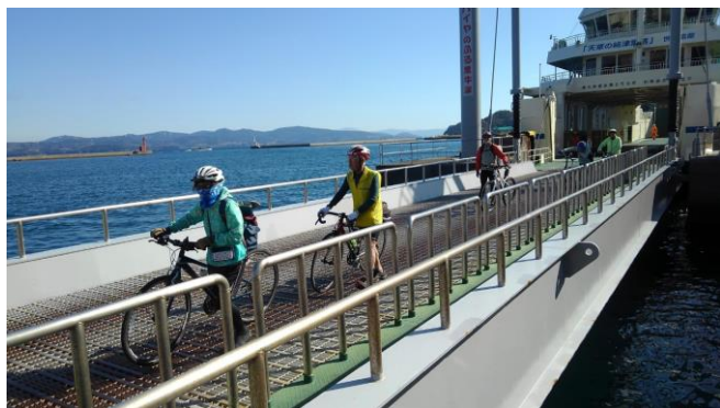
親善ライド 2018 九州、鹿児島から天草牛深に渡る