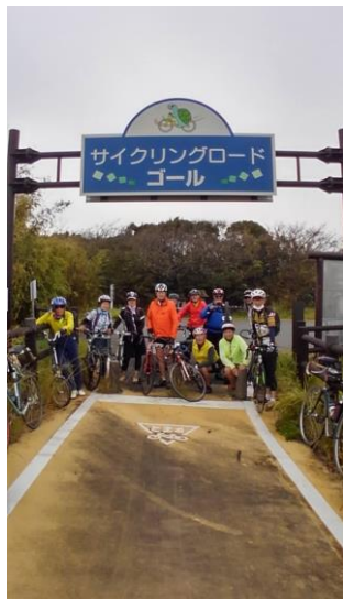
吹上浜サイクルロード