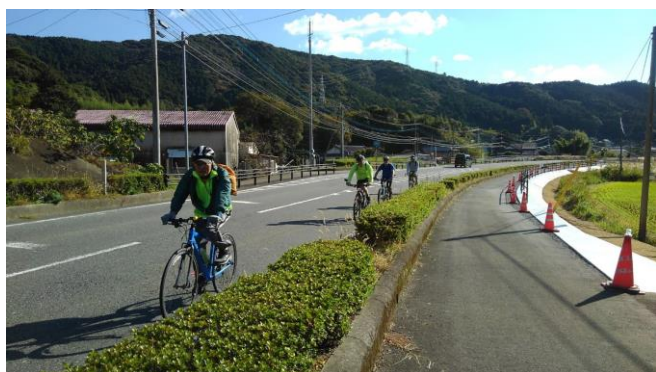
親善ライド 2018 九州ライド随一の山越えの後を軽快に