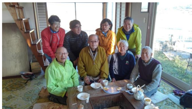
12月月例ライド後の五目御飯と赤飯パーティ、山本別宅