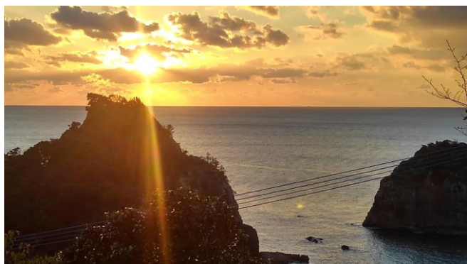
親善ライド 2018 絶景、東シナ海に沈む西天草の夕日