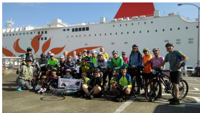
鹿児島志布志港から親善ライド2018スタート