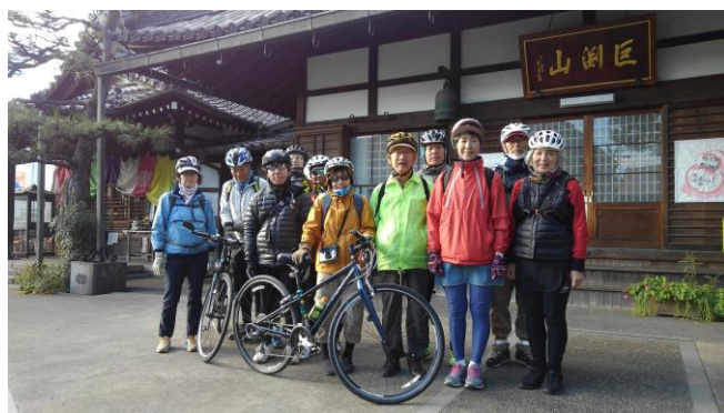
知多四国 81 番知多八幡龍蔵寺本堂前にて、12月15日

コースは第5回知多四国自転車巡礼で山本別宅→西知産業道路新舞子→岡田72 慈雲寺→77 浄蓮寺 73 正法院 75 誕生堂 74 蜜巖寺 76 如意寺→78 福生寺→番外→79 妙楽寺→80 晒光院→81 龍蔵寺→山本別宅(走行距離26km)。