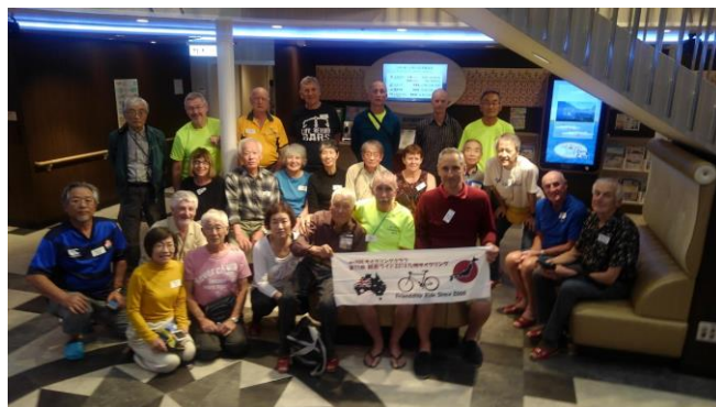
さんふらわあ夕食歓迎会後の船中ロビー2018年11月8日

観光名所 肝属川サイクリングロード、フェリー船中泊、肝属川サイクリングロード、鹿屋航空資料館、桜島・錦江湾サイク、指宿温泉、開聞岳登山、釣り、知覧平和公温泉、吹上浜サイクルロード、西天草の海と夕日、天草長崎キリシタン世界遺産、西天草風来望アウトドア、雲仙天草国立公園、雲仙小浜温泉、長崎市内観光、博多・大阪市内観光