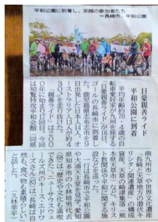
親善ライド 2018 終了記事