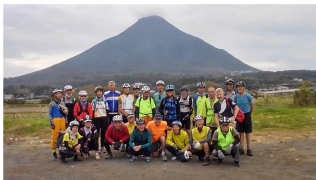
親善ライド2018九州5日目開聞岳をバックに全員集合