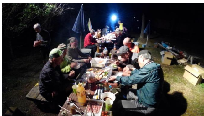
指宿田舎やでのアウトドアBBQ