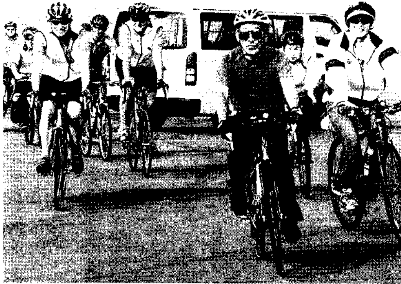
青森港で合流し、快調に走り出すメンバー

サイクリングに臨むのは、愛知県の高齢者自転車愛好会「abc RIDE」の十二人と、オーストラリアのサイクリスト八人の計二十人。日豪合同で二〇〇〇年から世界各地で自転車の旅を行っており、今回は六回目の開催となる。当初、北海道を走る計画だったが、洞爺湖サミットの開催で警備が厳しくなることから、本州最北端の青森県をコースに決めたという。