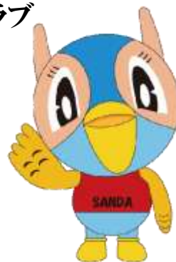
三田市マスコットキャラクター 『キッピー』