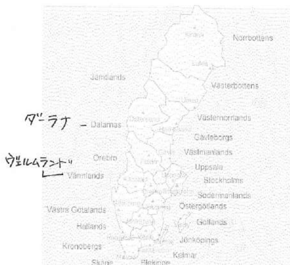
②スウェーデンのレーン (län=県 or 州)