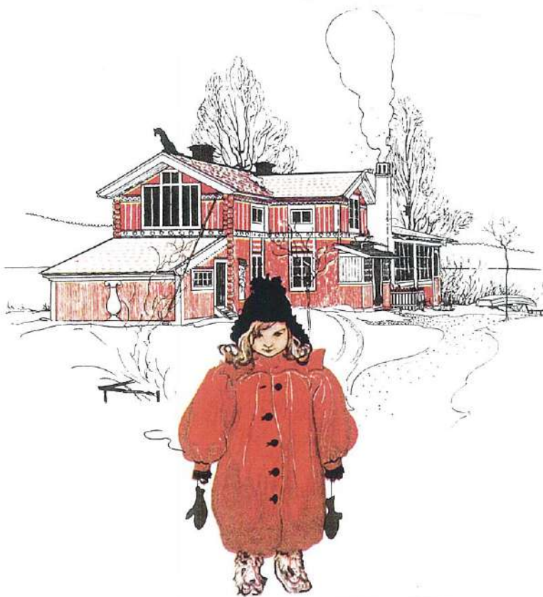
④カール・ラーションの絵。ラーションは、ダーラナ地方の一般の人々、とりわけ自身の家族を題材とし、人気を博した。