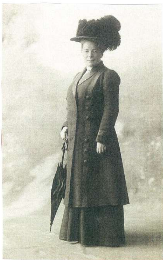
③旅行服を着たラーゲルレーヴ (1900年撮影)