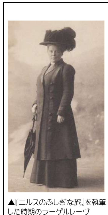
▲『ニルスのふしぎな旅』を執筆した時期のラーゲルレーヴ

ラーゲルレーヴは教員を務める傍ら、短編や詩を女性雑誌に投稿。1891年、長編『イェスタ・ベルリグのサガ』でデビュー。1894年に専業作家となり、長編『エルサレム』(1901/02)で、1909年に女性初・スウェーデン人初のノーベル文学賞受賞。『ニルスのふしぎな旅』(1906/07)は80か国語以上に翻訳される。1914年、女性初のスウェーデン・アカデミー(ノーベル文学賞選出で知られる)会員となる。1940年、買い戻した生家で死去。