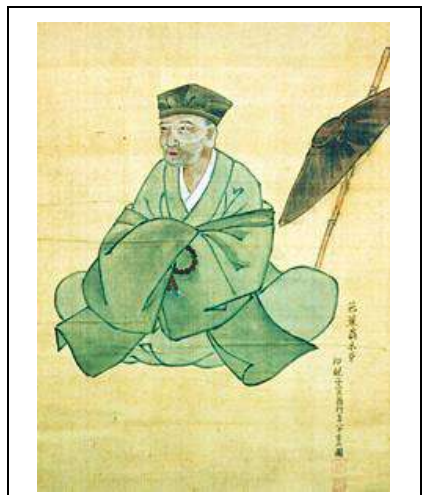
Ogawa Haritsu (小川破笠): Matsuo Bashō.