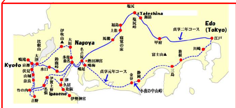
Bashōs Reise 1864-65