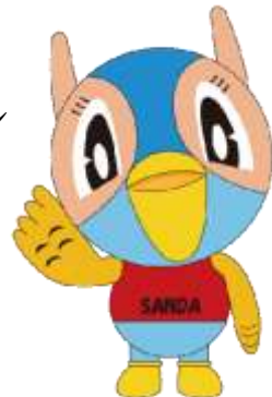
三田市マスコットキャラクター 『キッピー』