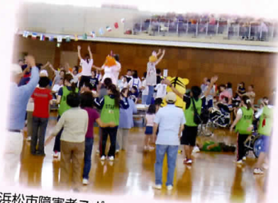
浜松市障害者スポーツ大会