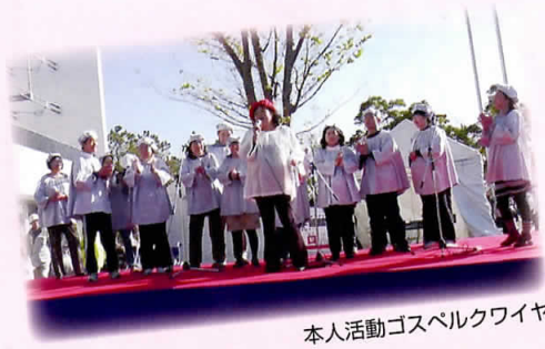
本人活動ゴスペルクワイヤ