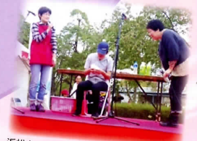
浜松キャラバン隊の公演

賛助会員として、会の運営を支えていただいています。正しい障がい理解のために、「浜松キャラバン隊」が劇劇を中心とした公演活動を各地で行っています。主に学生を対象としたボランティア育成研修会を開催し、私たちの子供と近い世代に障がい理解を深めてもらいます。