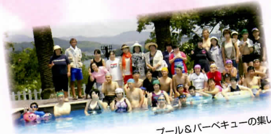
プール&バーベキューの集い